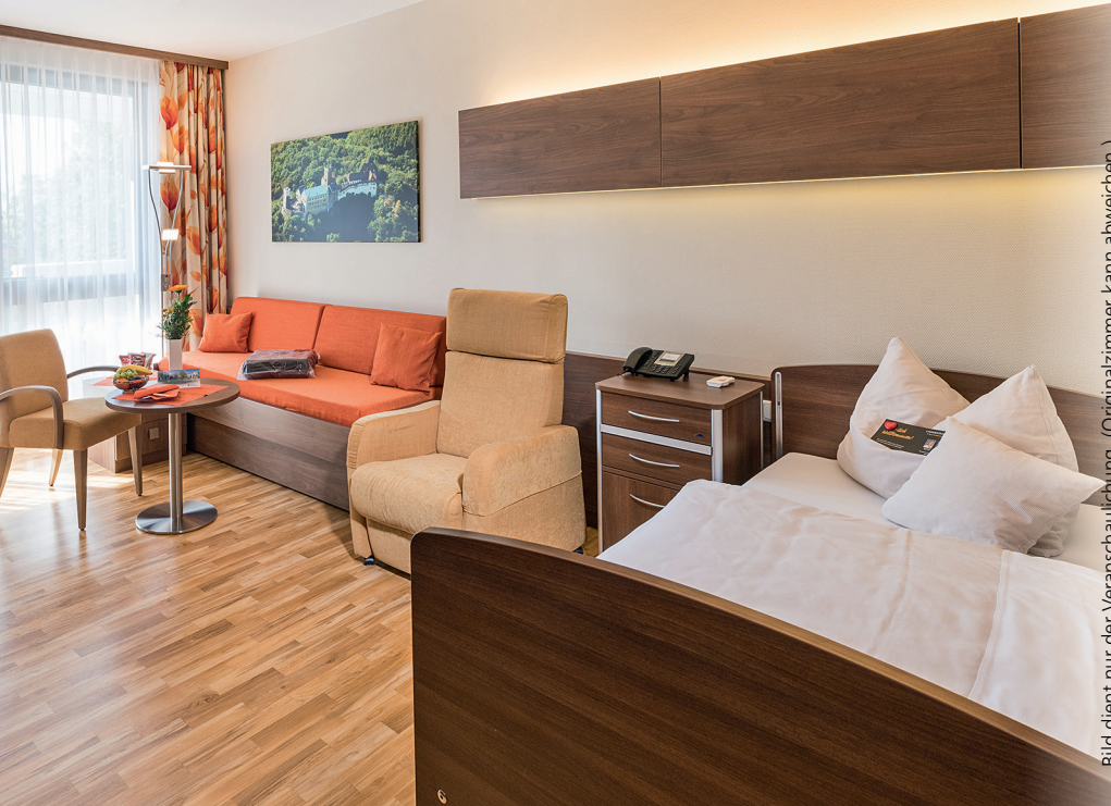
Bild dient nur der Veranschaulichung. (Originalzimmer kann abweichen.)